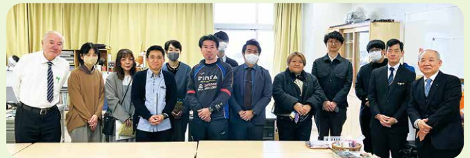
開邦中学校の先生方との記念写真