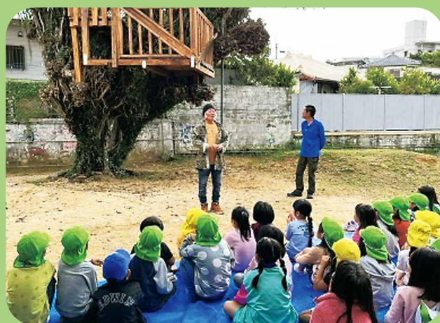
オープン式。作業に大きく関わった方の話を全園児で聞く。