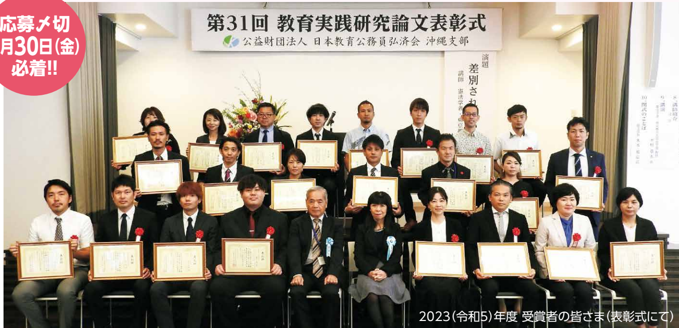
2023(令和5)年度 受賞者の皆さま(表彰式にて)