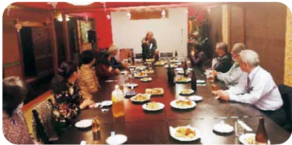
令和6年2月10日開催(宮古地区)

今年度から定年延長で、61歳定年を迎える会員の皆様、早期退職を希望されている皆様、長年の教職生活お疲れさまでした。沖縄支部では、退職者へ向けた手続きやセミナーを11月と2月に開催しています。そして、定年後、教弘保険継続者には、いろいろな事業や福祉が受けられる「友の会」会員として会費なしの恩恵があります。その友の会活動の一環として事業説明会・セミナー・懇親会を準備しています。お楽しみに！