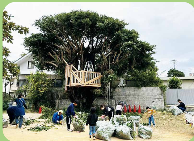
作業過程。出来る人が出来ることを行っているのが印象的であった。