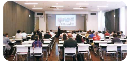
令和6年2月21日開催(那覇・島尻地区)