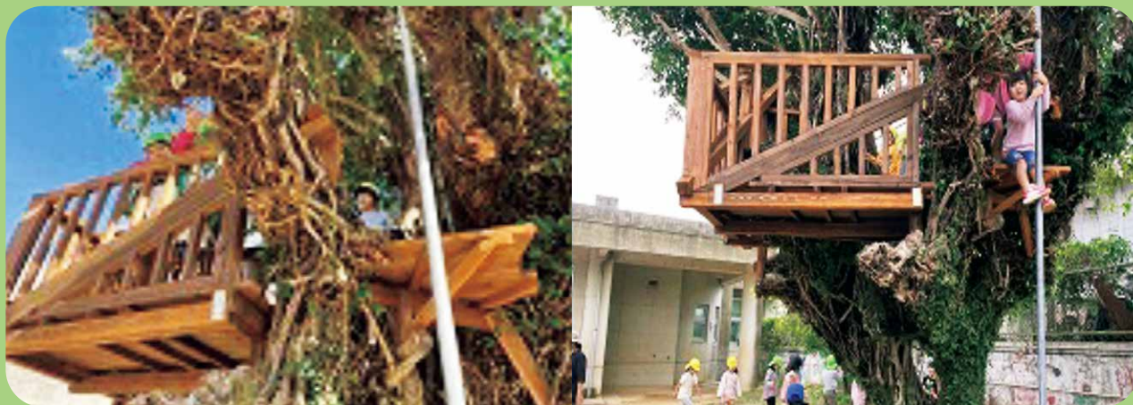
自分たちで作ったルールのもと、遊びを楽しむ園児。