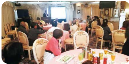
令和6年2月19日開催(中頭地区)