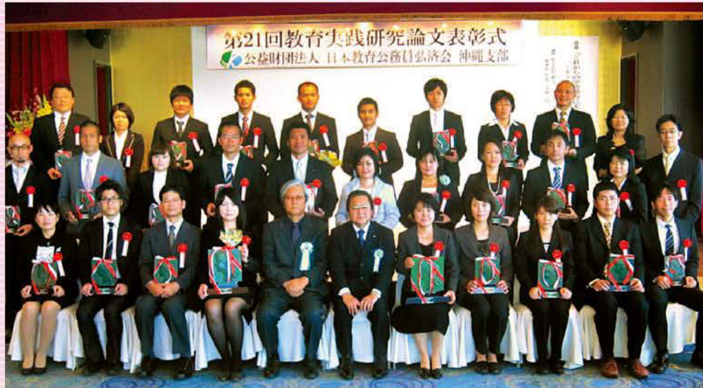
平成25年度 第21回教育実践研究論文表彰式