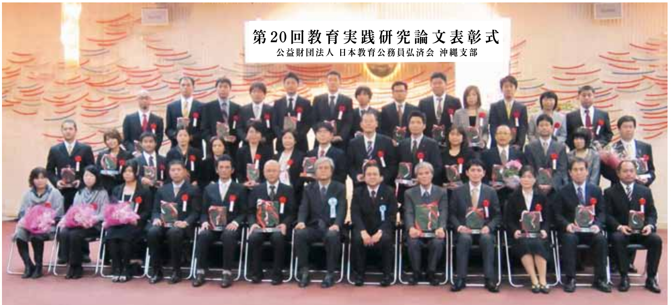
平成24年度 第20回教育実践研究論文表彰式