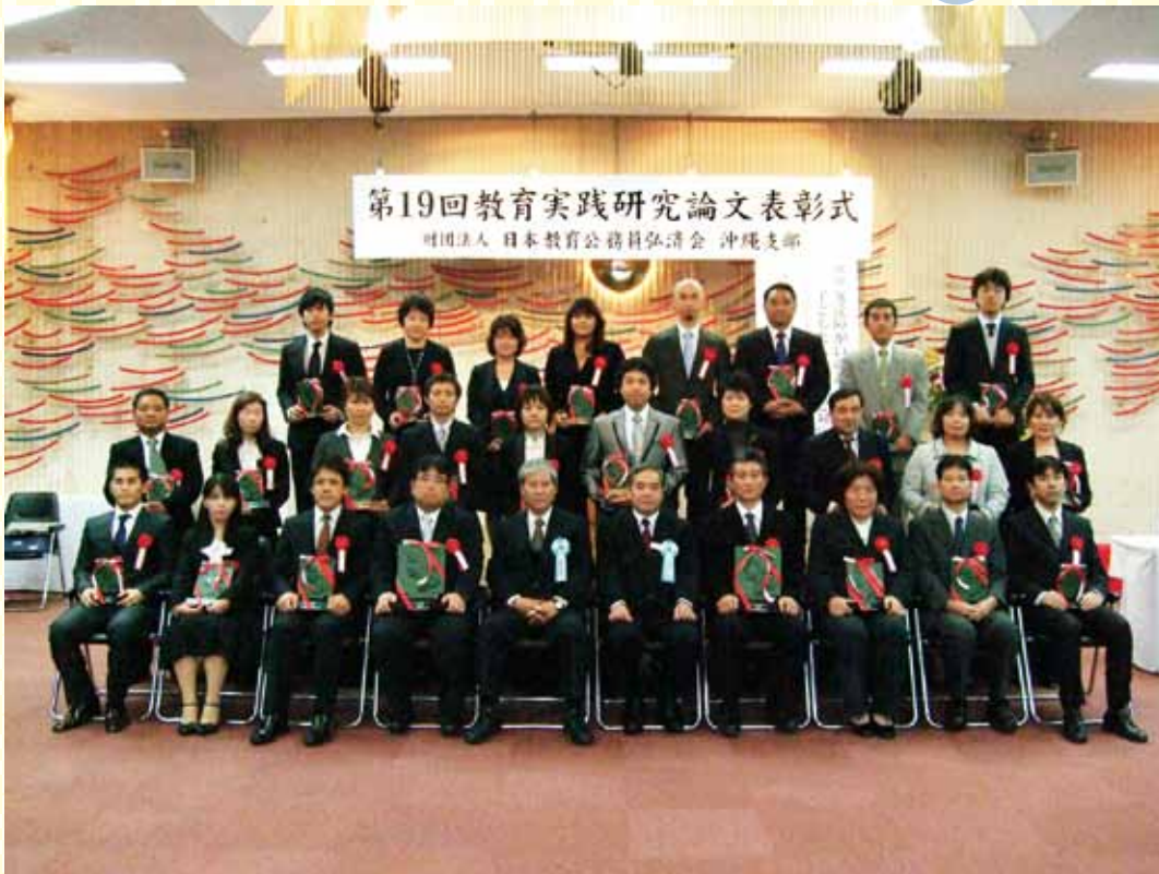
平成23年度 第19回教育実践研究論文表彰式