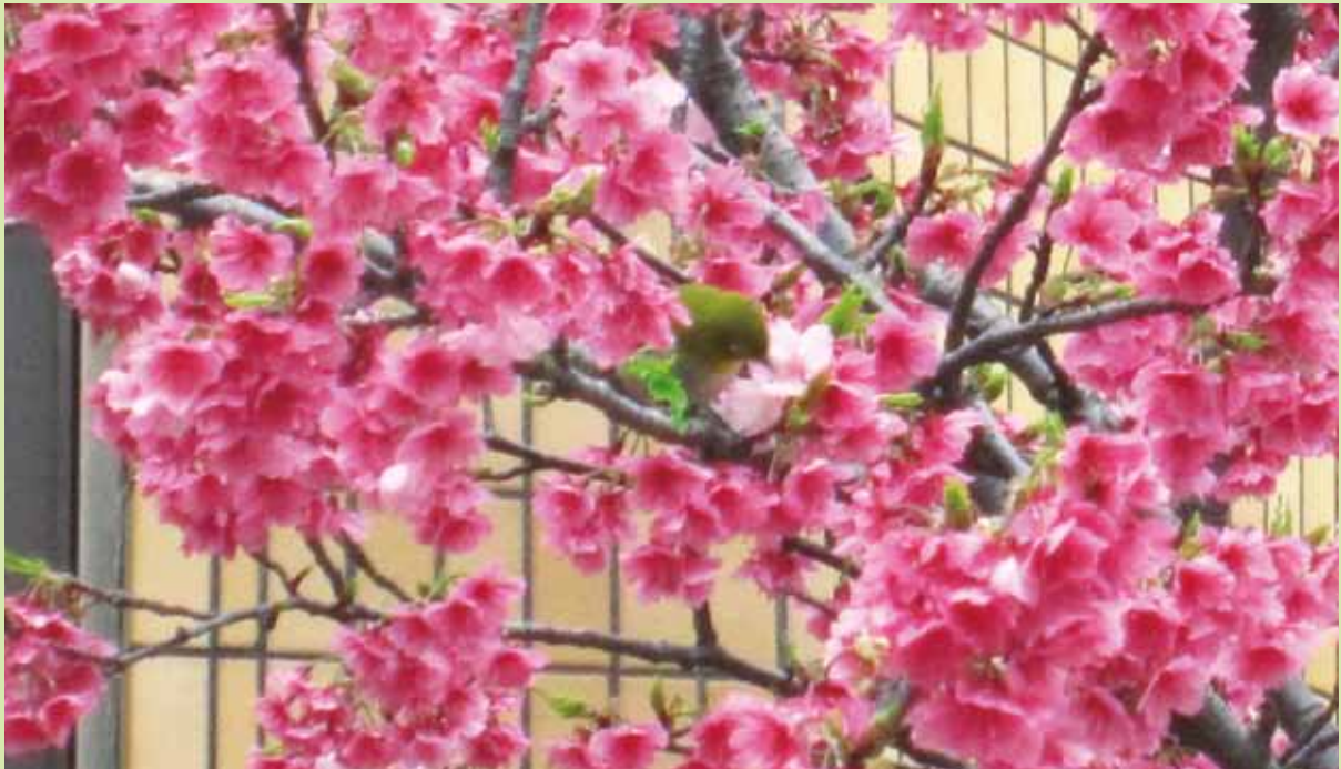
寒緋桜 (財)日教弘沖繩支部事務所前 2011/2)

編集：(財)日本教育公務員弘済会沖繩支部 発行：(有)沖繩教弘 2011年3月1日 〒900-0014 沖繩県那覇市松尾 1-7-12 TEL：098-867-1765 FAX：098-869-3544 http://www.nikyoko.or.jp/